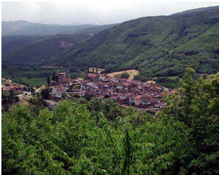
Vista general del valle Cuerpo de Hombre desde Montemayor del Rio

En el resto del valle, son los cambisoles húmicos, gleicos y dístricos los suelos más extendidos. Los húmicos están bastante extendidos en el valle y sobre ellos se ubican los robledales del Quercion roboripyrenaicae . Los cambisoles dístricos aparecen en distintos puntos de ambas laderas y en ellos se desarrollan los escobonares de Cytisetalia scopario-striati .