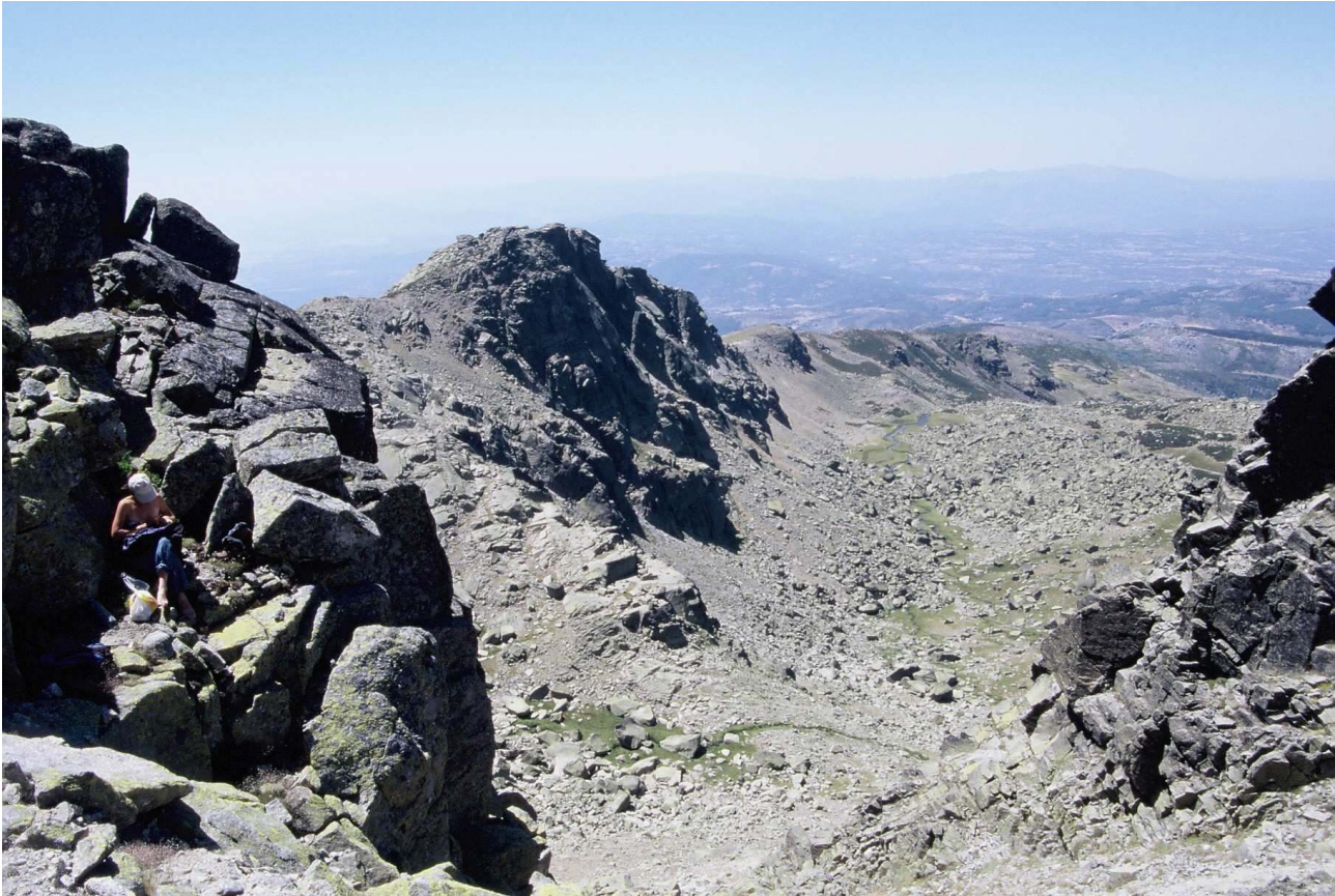
Geología de la zona (Circo de Hoyamoros)

Geológicamente esta formada por rocas de origen paleozoico: plutónicas (Granitos) y metamórficas (Pizarras, cuarcitas...). Sus sierras se formaron en la orogenia hercínica y adquirieron su disposición actual durante la orogenia Alpina. Los procesos erosivos y geomorfológicos dieron lugar a su aspecto actual