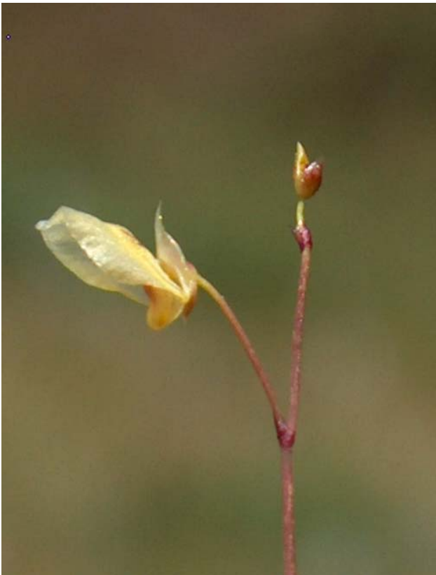
Fotografía 7. Detalles de la inflorescencia en racimo, con 2-6 flores y una flor vista de perfil. Se observan labio superior ovado, entero; labio inferior obovado, indiviso, con una giba redondeada. Fuente de la Bruja (León)