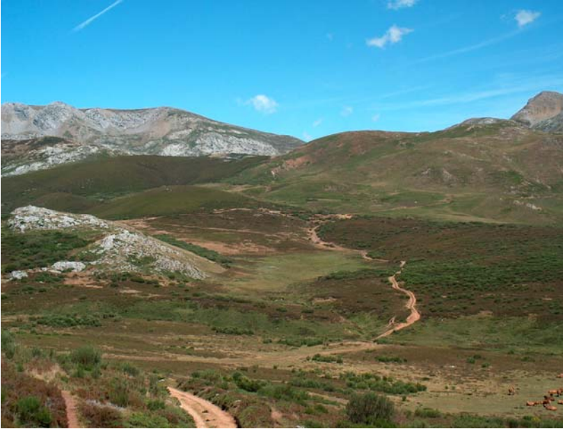
Fotografía 11: Pistas atravesando y rodeando la turbera de la Fuente de la Bruja (León). En la esquina inferior derecha se ve el ganado que frecuenta la zona aunque la presión ganadera ha disminuido en los últimos años