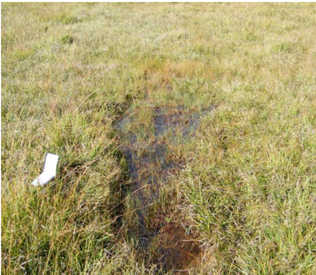
Fotografía 2. Hábitat un tanto particular en al Fuente de la Bruja, La Cueta (León): pequeñas pozas o charquitas de aguas neutras o básicas en el seno de turberas meso-eútrofas del Caricion davallianae (14.c.04.101).