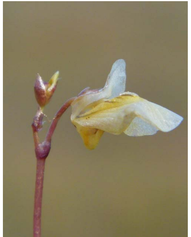
Fotografía 8. Mismos detalles que la foto anterior En esta caso con la flor decolorada. Fuente de la Bruja (León).