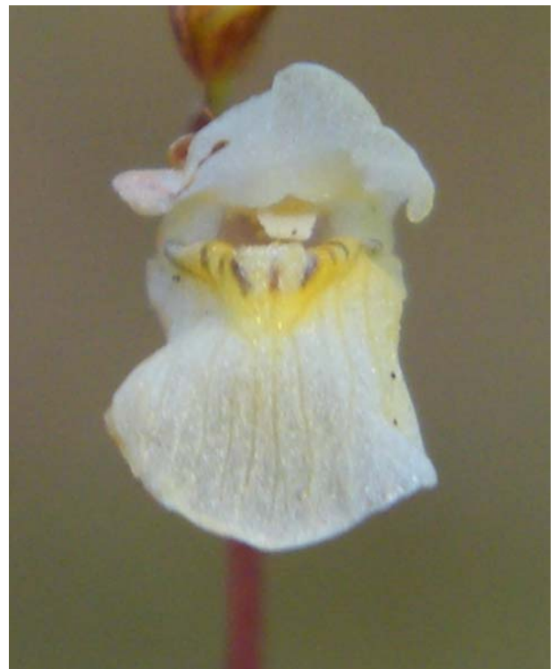
Fotografía 10. Detalle de la misma flor que la fotografía 8 vista de frente.