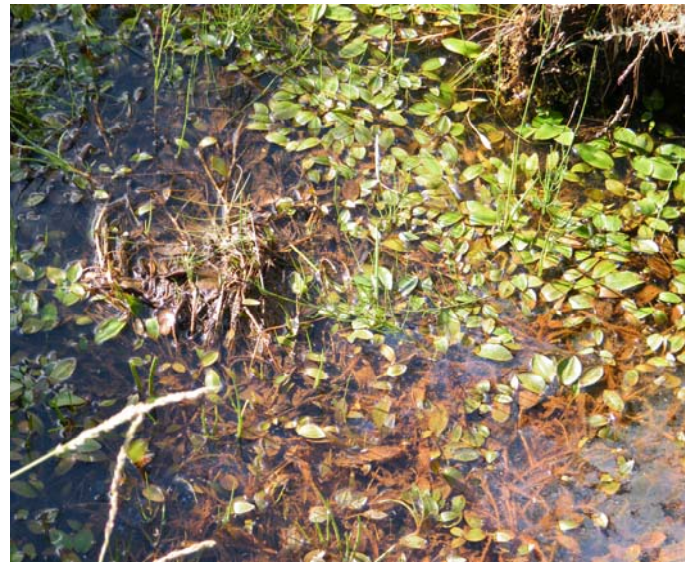
Fotografía 3. Estanques cenagosos o pocetas en el interior de un brezal hidrófilo del Genisto anglicae-Ericetum vagantis (61.a.07.011). En dichas pocetas poco profundas comunidades dominadas por Juncus bulbosus y Potamogeton polygonifolius del Hyperico-Sparganion (10.a.02.101) entremezcladas con comunides Sphagno-Utricularion (15.a.01.101).