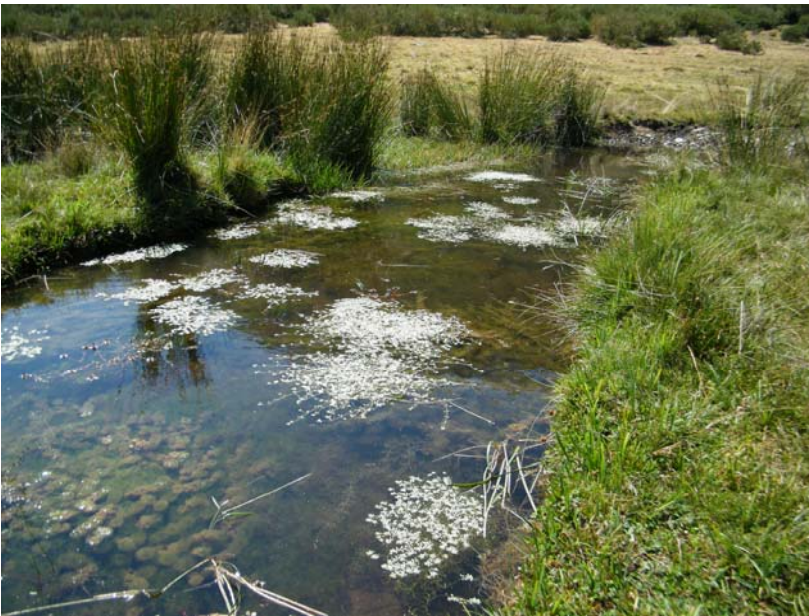
Fotografía 12: Juncales invadiendo antiguas comuniades higroturbosas. Es una zona con mucha presión ganadera en la que en ese pequeño regato estancado y otro aun más pequeño aparecen de modo muy puntual Utricularia minor y Callitriche palustris , que antaño seguramente eran más abundantes. Valle de Santiago, Fasgar (León)