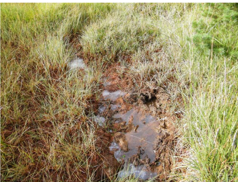
Fotografía 13: Pisoteo y eutrofización por el ganado de una poza a pocos m de la de la fotografía 3. Aquí no había Utricularia minor . En la esquina superior derecha se ve un pino escapado de un cultivo que hay a pocos metros.