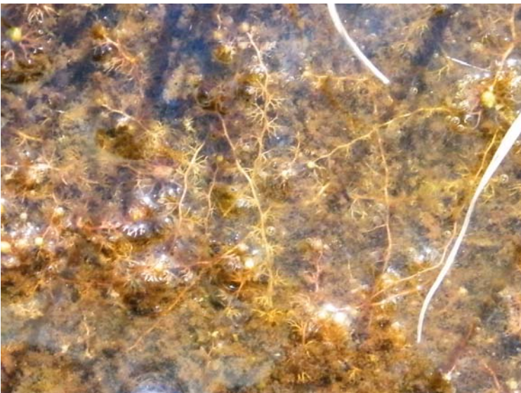
Fotografías 5 y 6. Detalle de los tallos flotantes y sumergidos con los órganos foliares dimorfos (unos de perímetro más o menos circular, verdosos, palmatidividos y casi sin utrículos y otros dicotómicamente divididos, con reducido con reducido número de segmentos, descoloridos y con mayor número de utrículos que los anteriores).