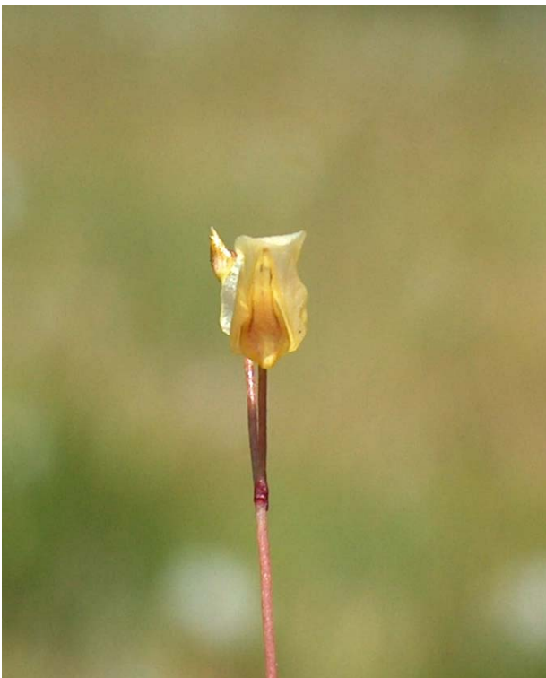
Fotografía 9. Detalle de la misma flor que la fotografía 7 vista de frente.