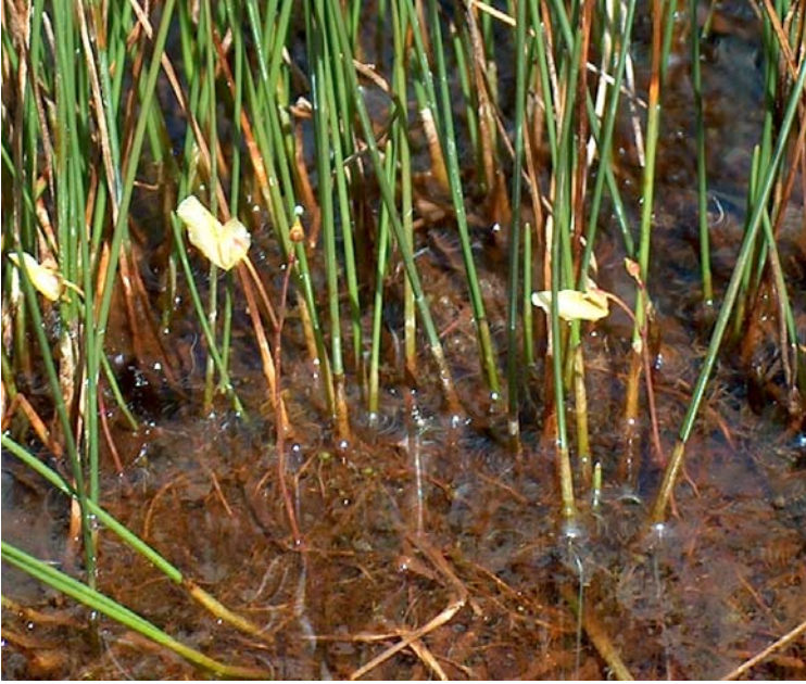
Fotografía 4: Plano general de planta con los tallos y órganos foliares flotantes y el pedúnculo florífero que emerge erecto. En el hábitat de la fotografía 2.