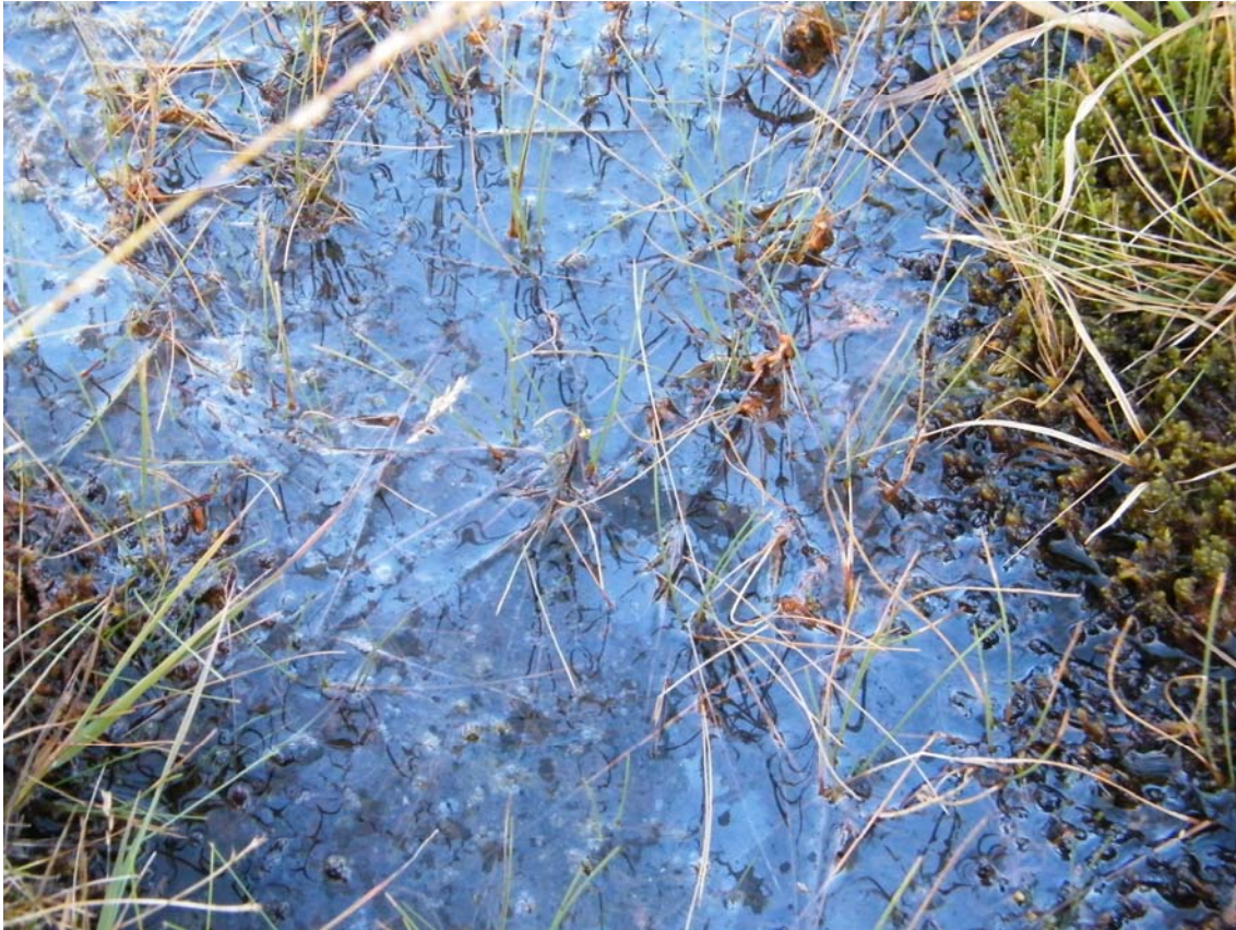
Fotografía 1. Hábitat óptimo para Utricularia vulgaris : pequeños estanques cenagosos, pocetas e hilillos de desagüe en el seno de turberas (principalmente oligotróficas). En esos ambientes forma parte de unas comunidades particulares: Sphagno-Utricularion (15.a.01.101).