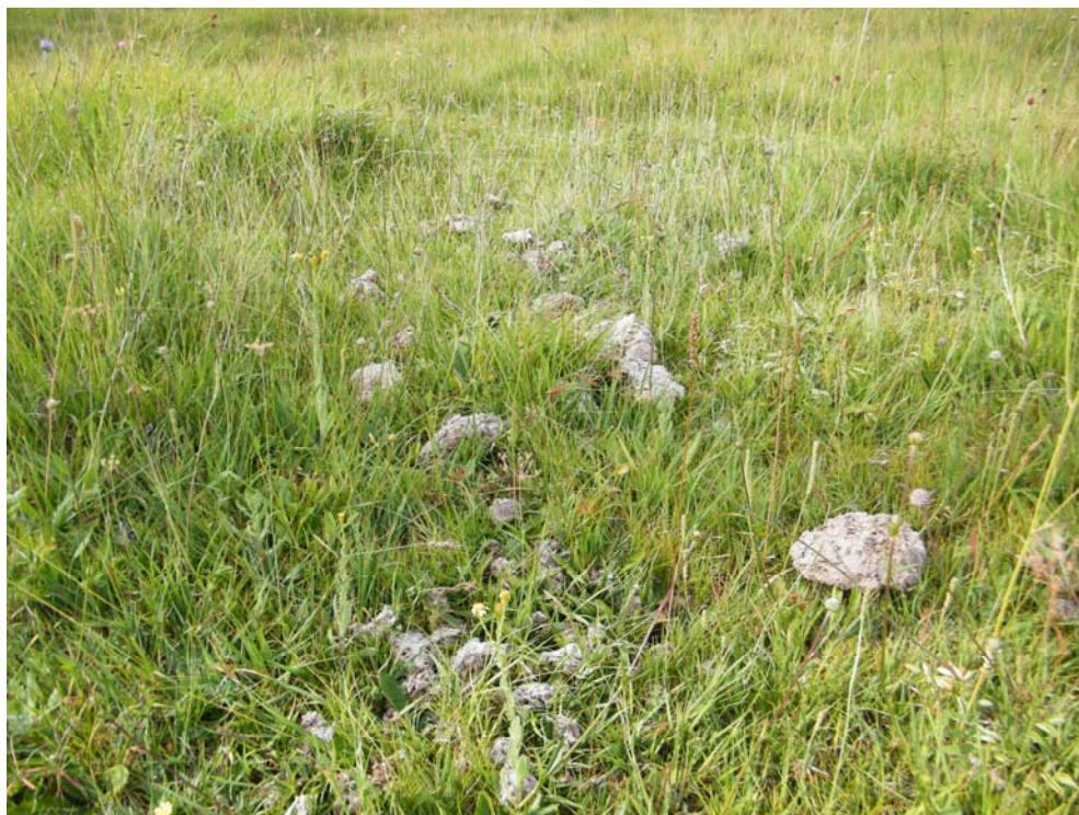
Fotografía 11. Pastoreo, pisoteo y nitrificación por presencia de ganado en pradera de Molinion caeruleae . La Valcueva-Avisdos (León).