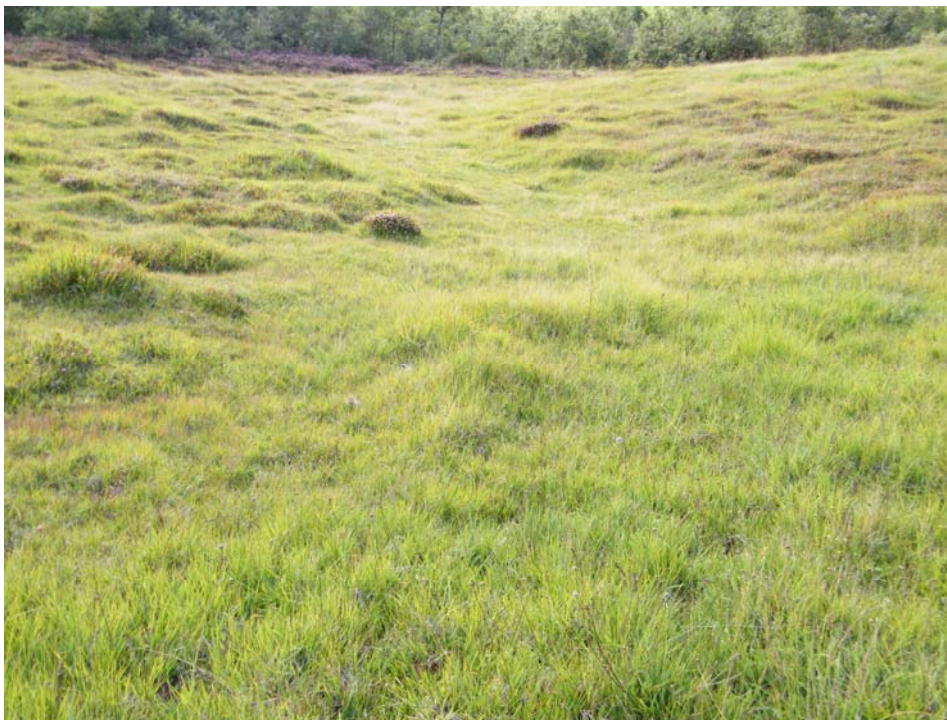
Fotografía 2. Uno de los hábitats principales para la especie: prado higrófilo, neutro-basófilo del Molinion caeruleae (59.a.01.101). La Valcueva (León).