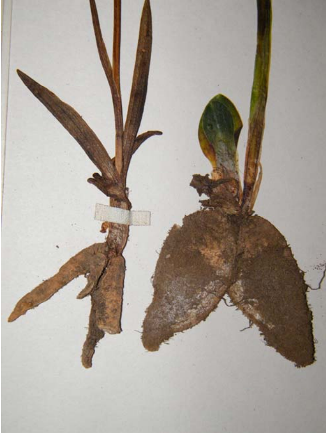
Fotografía 5. Detalle de la parte inferior de S. spiralis (drcha), con las hojas ovado elípticas, en una roseta situada al lado del tallo fértil y tubérculos elipsoideos y S. aestivalis (izda) con las hojas linear-lanceoladas, que abrazan la parte inferior del tallo fértil y tubérculos napiformes. Material de herbario: S. aestivalis (LEB 5372); S. spiralis (LEB 83116).