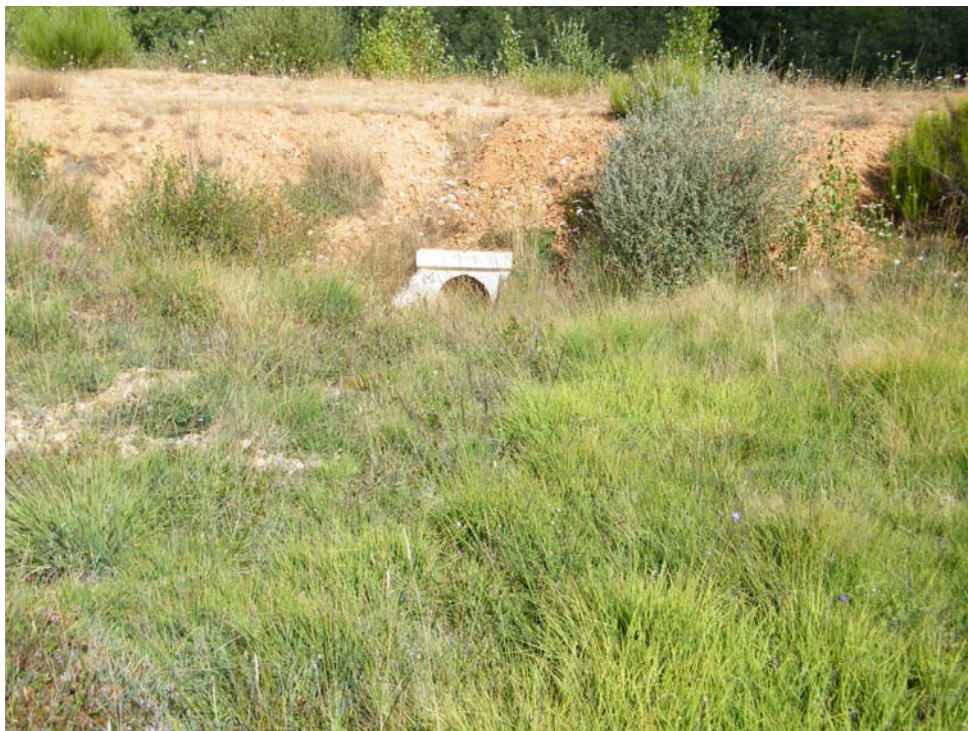
Fotografía 10. Vista de la pista anterior desde la pradera de Molinion caeruleae . Se observa el deterioro de la misma.