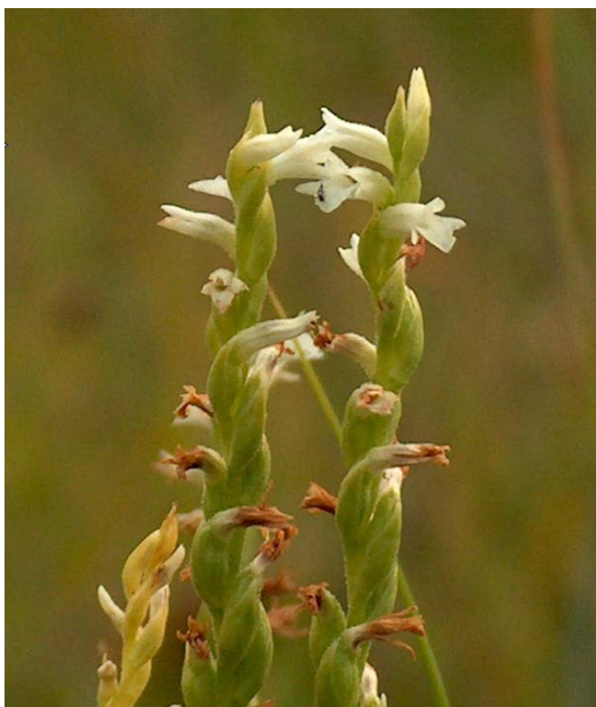
Fotografía 8. Detalle de la parte superior de la inflorescencia de la fotografía anterior.