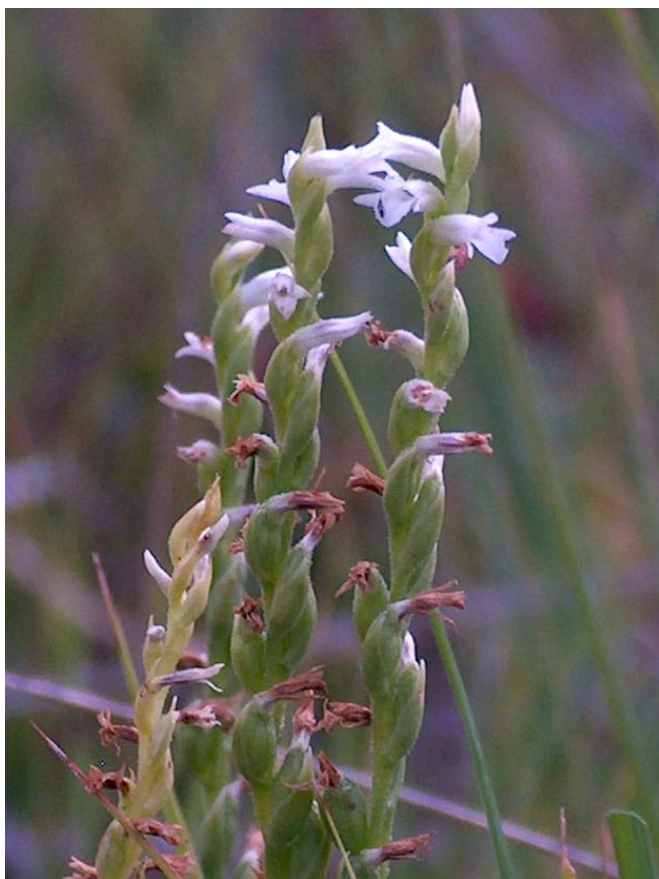
Fotografía 7. Detalle de la la inflorescencia con el eje retorcido (flores dispuestas helicoidalmente). En la parte superior en flor y en la inferior comenzando la fructificación.