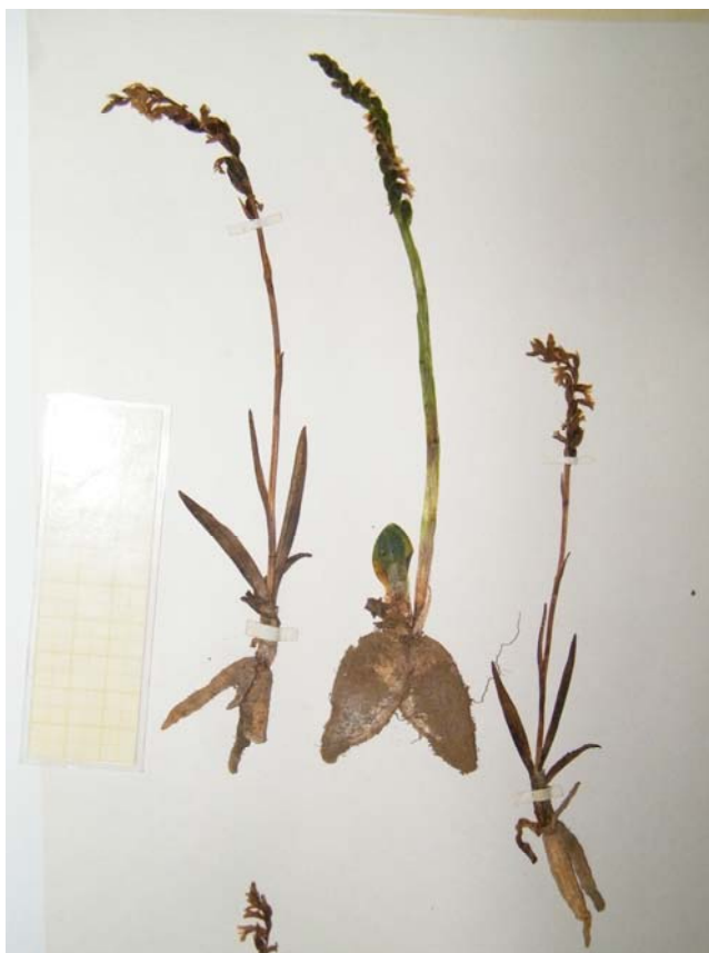
Fotografía 4. Plano general de dos ejemplares de S. aestivalis y 1 de S. spiralis (en el medio). Material de herbario: S. aestivalis (LEB 5372); S. spiralis (LEB 83116).