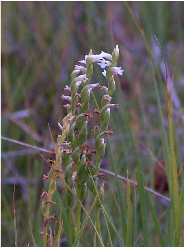
Fotografía 6. Detalle de la parte superior del tallo y de la inflorescencia.