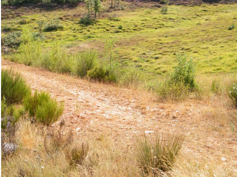
Fotografía 9. Pista realizada para la instalación de un gaseoducto que atraviesa varias praderas de Molinion caeruleae y turberas de Caricion davallianae , en las que se desarrolla S. aestivalis . La Valcueva (León).