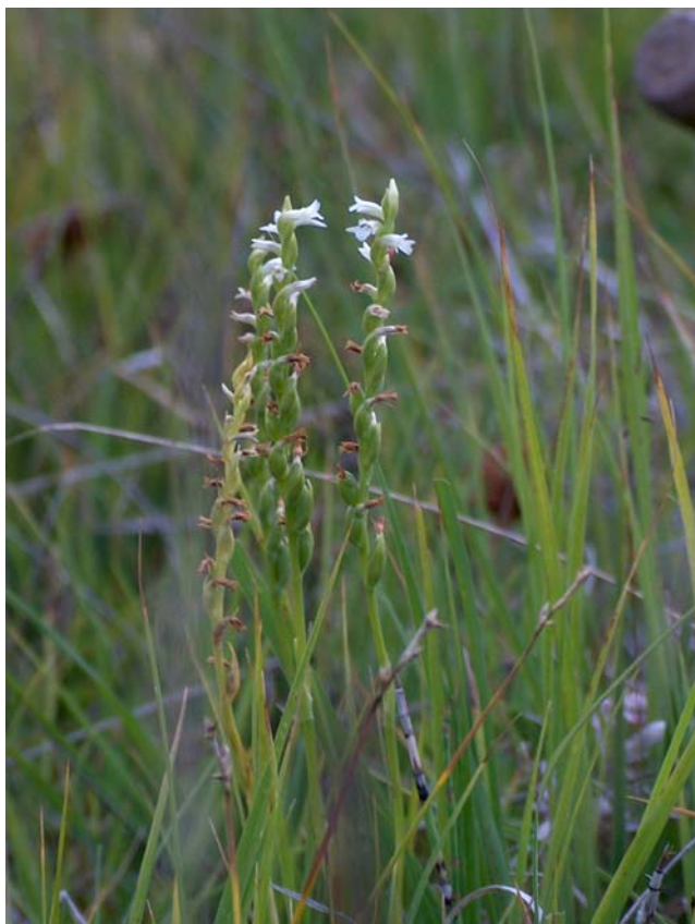
Fotografía 3. Plano general de la planta en el hábitat de la fotografía 1.