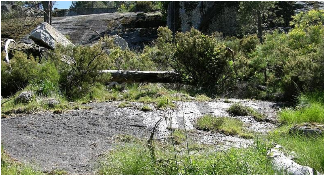
Fotografía 1. Hábitat óptimo de Sedum campanulatum , en comunidades efímeras supra-oromediterráneas que se desarrollan sobre litosuelos silíceos alimentados por fenómenos de escorrentía temporal durante la primavera. Proximidades de Domingo Fernando (1350 m), El Hornillo (Av).