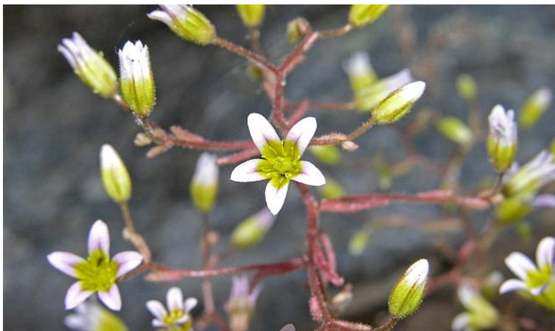
Fotografía 7. Detalle de la inflorescencia de Sedum campanulatum .