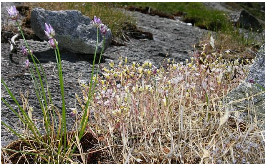
Fotografía 2. Comunidad de Sedum campanulatum acompañado de Allium schoenoprasum , Holcus gyanus y Sedum pedicellatum . Proximidades de Domingo Fernando (1350 m), El Hornillo (Av).