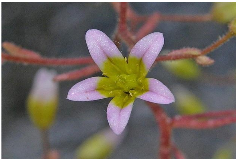
Fotografía 8. Detalle de la flor.