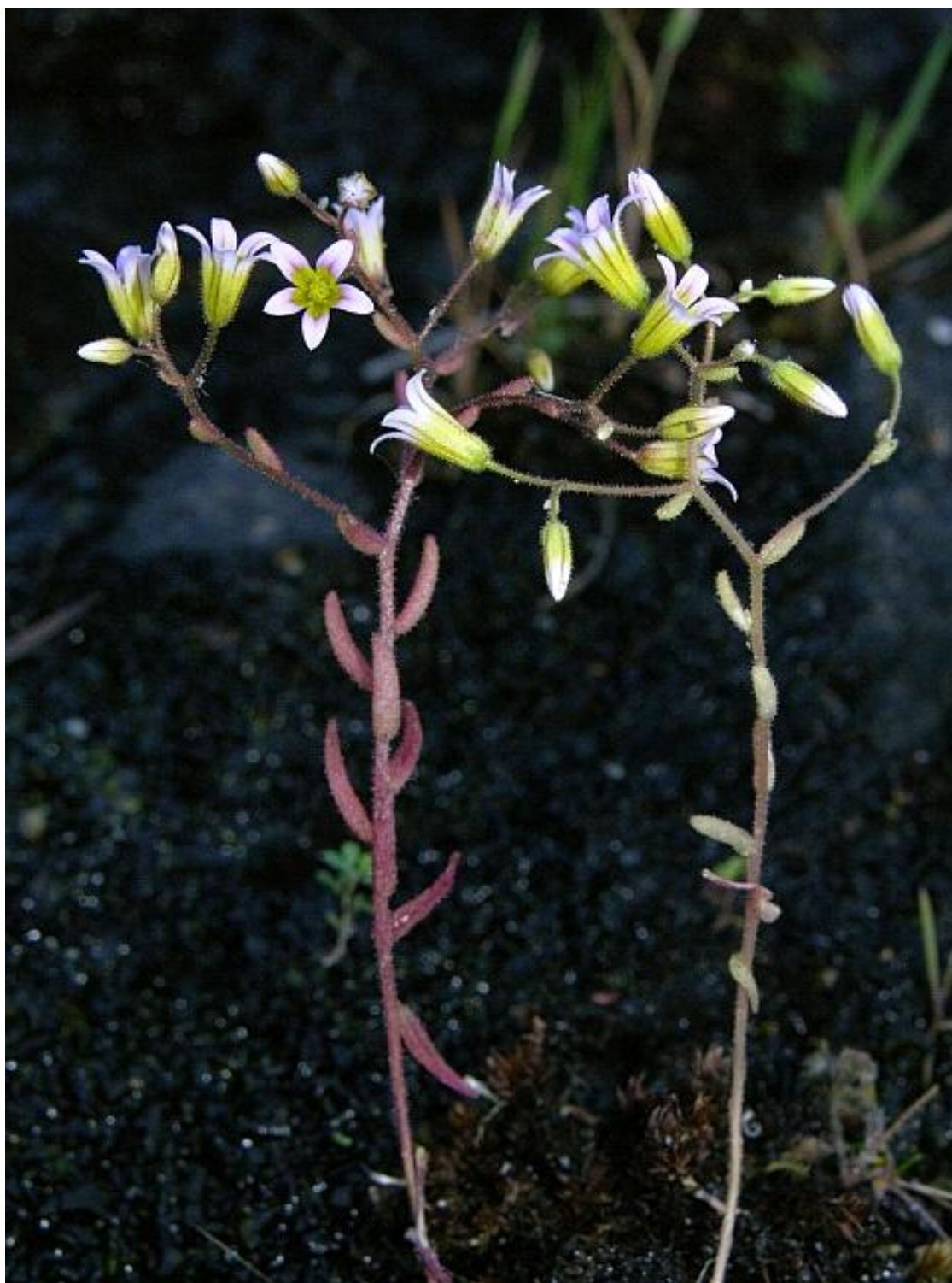
Fotografía 5. Hábito de Sedum campanulatum en el que se aprecia su tallo ascendente, morfología foliar y floral e indumento glanduloso.