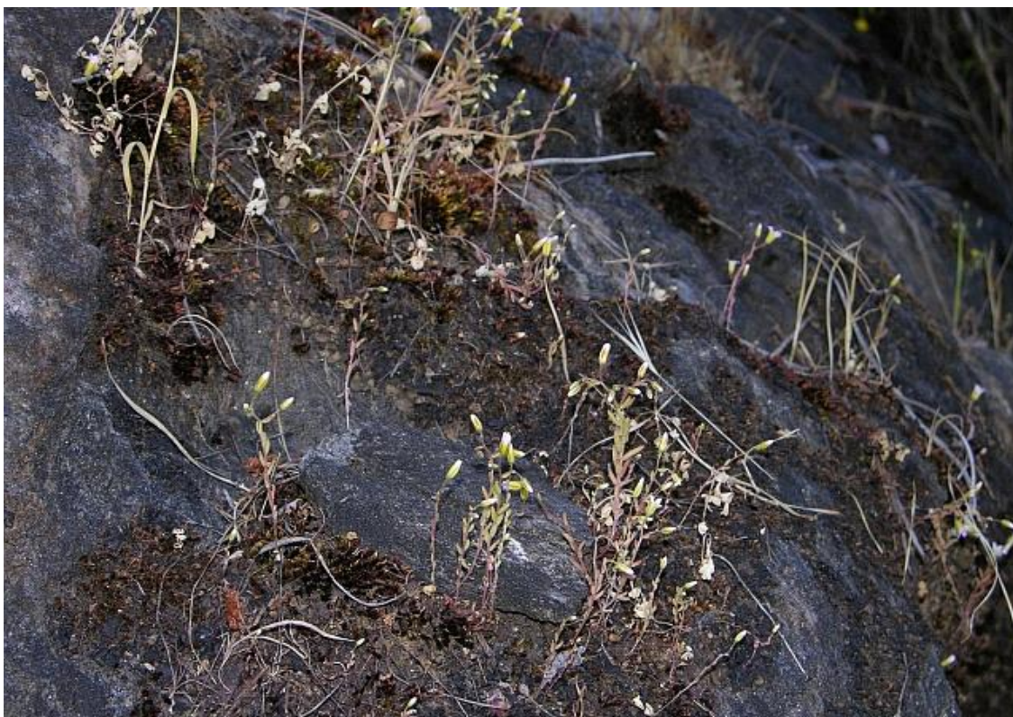
Fotografía 3. Hábitat minoritario de Sedum campanulatum , en repisas y grietas terrosas sobre afloramientos rocosos mesomediterráneos alimentados por surgencias temporales. Río Arenal, Puente de Pescadores (510 m), Arenas de San Pedro (Av).