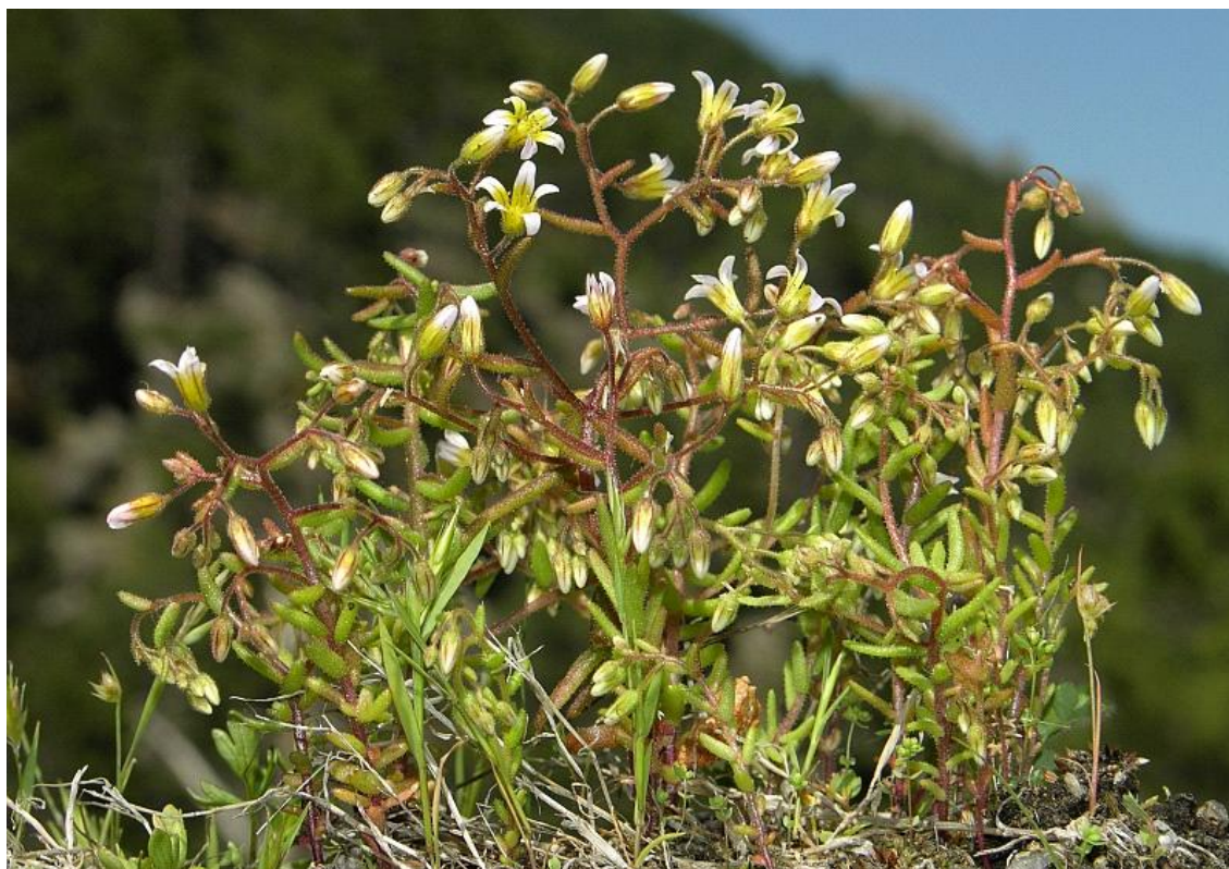
Fotografía 6. Población densa de Sedum campanulatum en su hábitat típico.