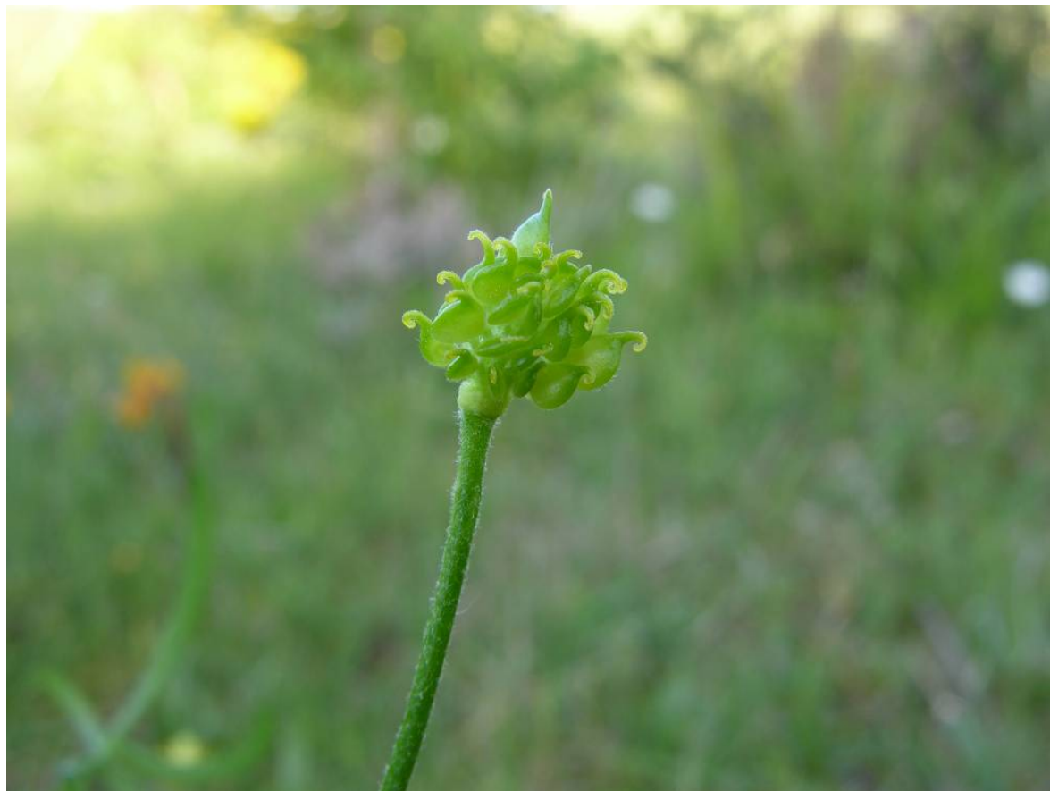
Fotografía 7. Aquenios casi maduros.