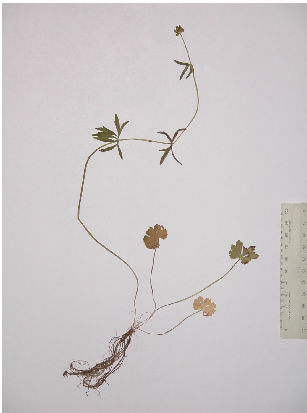
Fotografía 8. Imagen de un pliego de herbario de R. valdesii mostrando el sistema radical, las hojas basales, las caulinares y una inflorescencia casi madura.