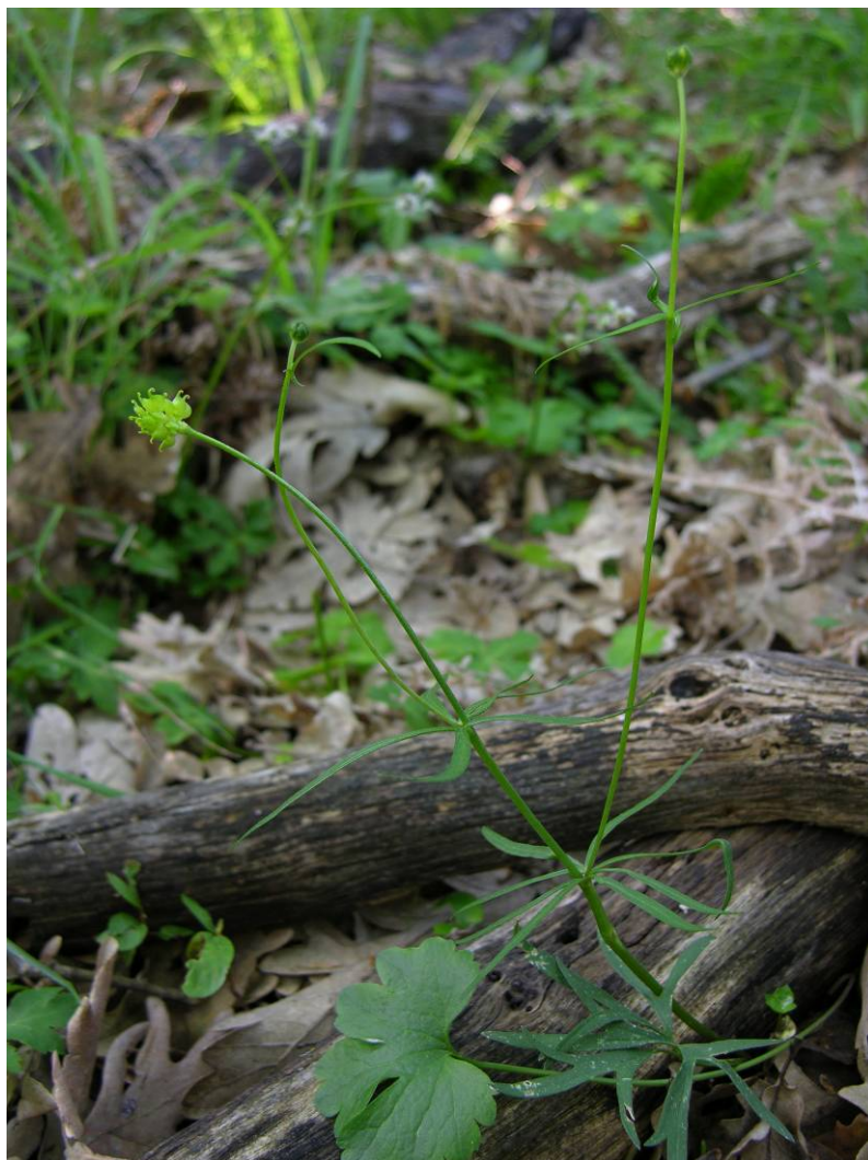
Fotografía 4. Ejemplar en fructificación.