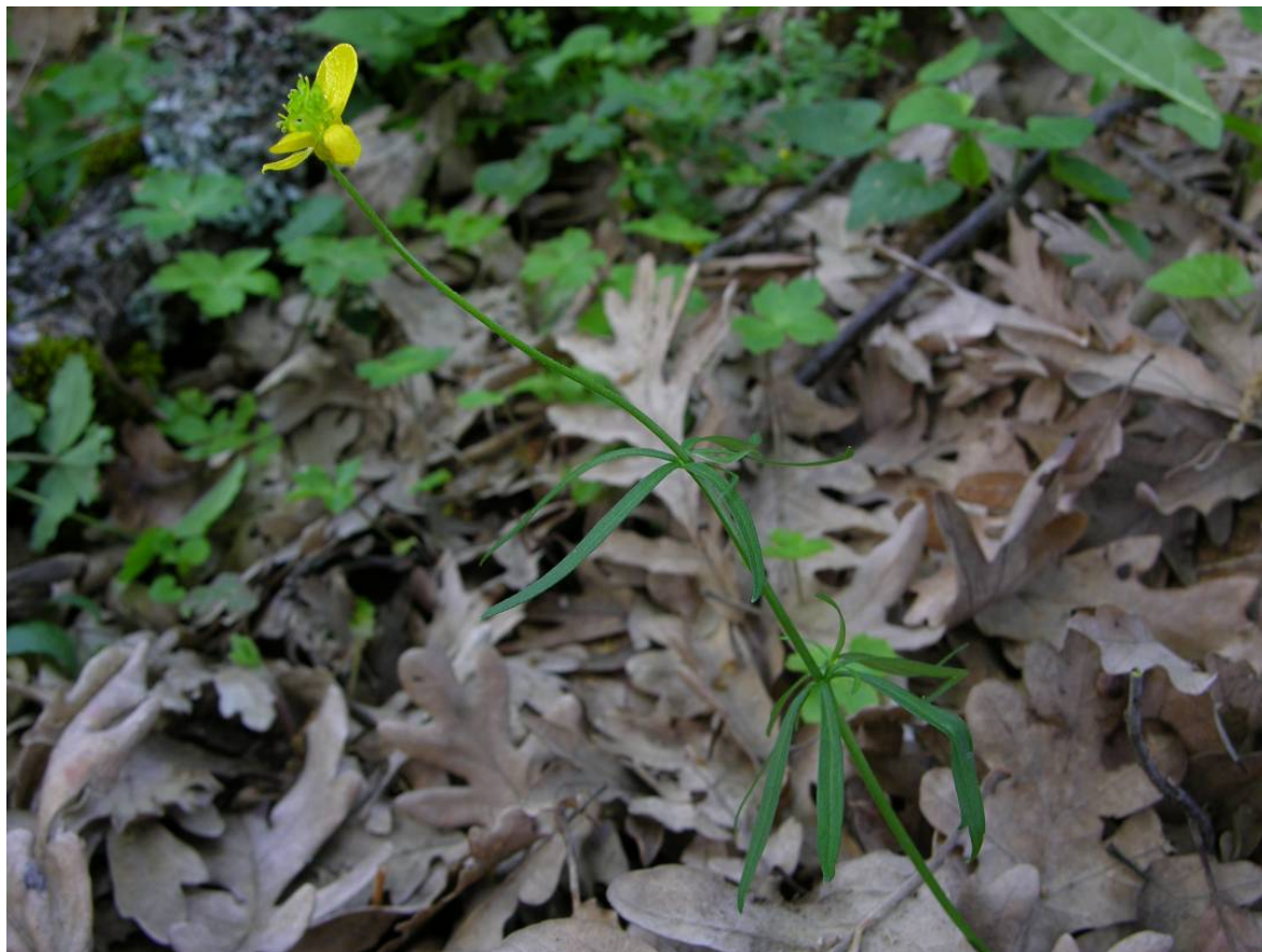
Fotografía 3. Un ejemplar de tamaño medio en floración avanzada.