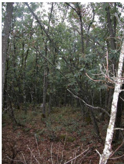
Fotografía 10. Melojares ayllonenses densos, de baja talla y con robles rebrotando. R. valdesii no se encuentra en este tipo de bosques.