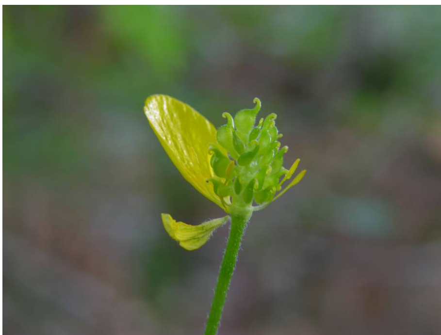
Fotografía 6. Idem.