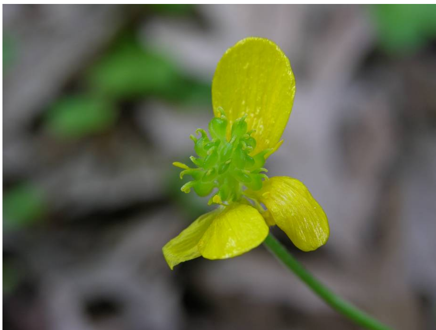
Fotografía 5. Detalle de flor con los aquenios en desarrollo.