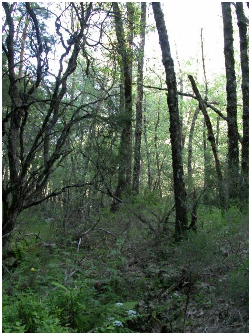
Fotografía 2. Idem.