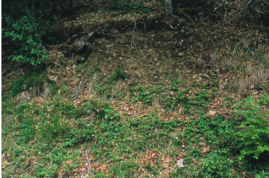
Fotografía 1. Hábitat de Ranunculus montserratii durante un censo.