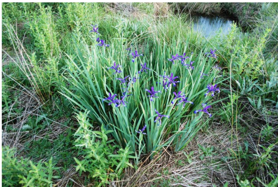
Fotografía 7. El drenaje del hábitat donde se desarrolla la planta afectaría su supervivencia