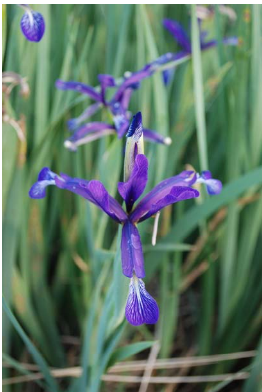
Fotografía 5. Detalle de la flor