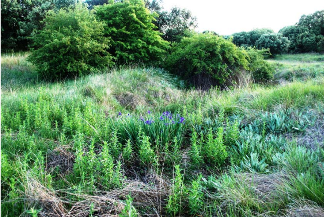
Fotografía 1. Vista general del hábitat de Iris spuria subsp. marítima en vaguada de encinar. Calzada del Coto (León).