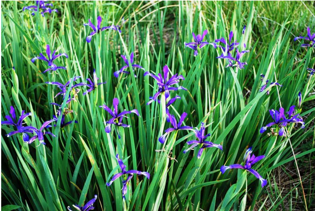
Fotografía 3. Aspecto de una población de Iris spuria subsp. marítima .