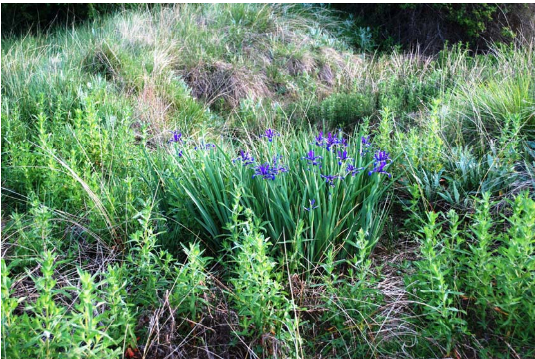
Fotografía 2. Vista general del hábitat de Iris spuria subsp. marítima en comunidad de Molinio-Holoschoenion vulgaris