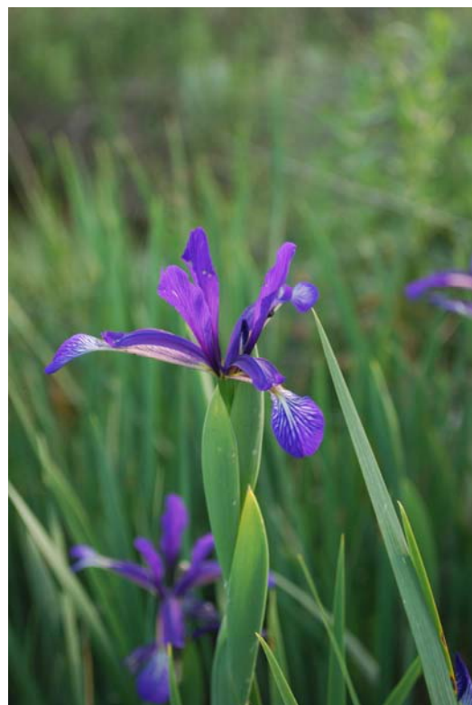
Fotografía 6. Detalle de las espatas herbáceas