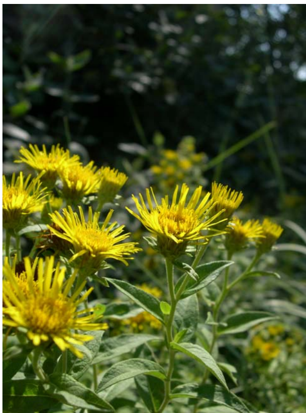
Fotografía 4. Capítulos de Inula helvetica en los que se aprecia que las lígulas sobrepasan claramente el involucre (Puentelarrá, Álava).