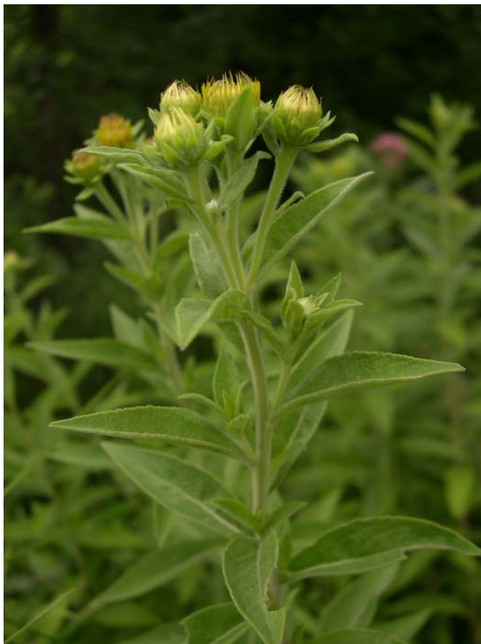
Fotografía 6. Detalle de la parte superior de un individuo de Inula helvetica , en el que pueden verse las hojas sésiles y cuneadas y la forma de las brácteas externas del capítulo (San Millán de San Zadornil, Burgos).