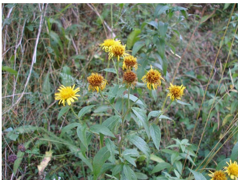
Fotografía 3. Vista parcial de la mitad superior de un individuo de Inula helvetica , en el que se aprecian varios capítulos, algunos ya en la fructificación (Espot, Lérica).