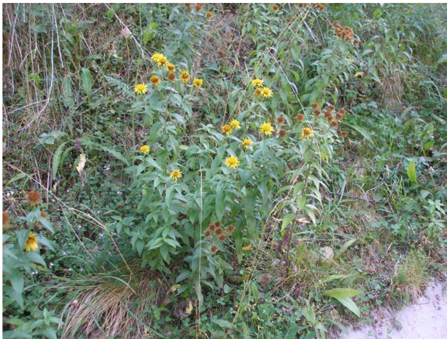
Fotografía 1. Vista general de varios individuos de Inula helvetica viviendo en taludes de una pista forestal (foto tomada en Espot, Lérida).