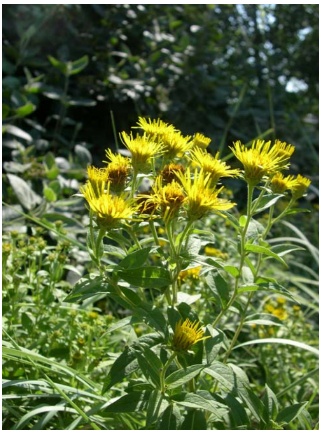
Fotografía 2. Vista parcial de la mitad superior de un individuo de Inula helvetica , en el que se aprecian varios capítulos en el momento de la antesis (Puentelarrá, Álava).