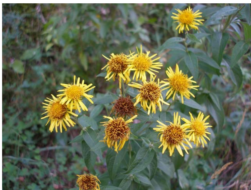
Fotografía 5. Capítulos de Inula helvetica , algunos en floración y otros en fructificación (Espot, Lérica).