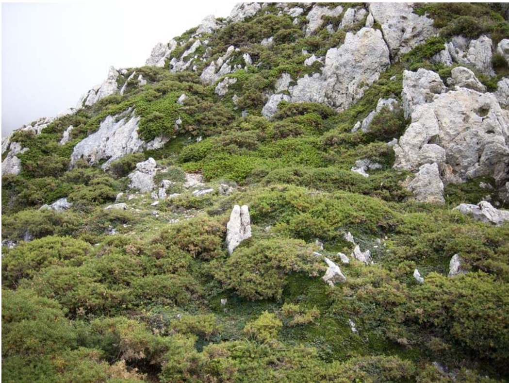
Fotografía 2. Hábitat anterior (52.b.08.101) en mosaico con aulagares de la asociación Lithodoro diffusae-Genistetum occidentalis (52.a.05.006), con presencia de Horminum pyrenaicum .