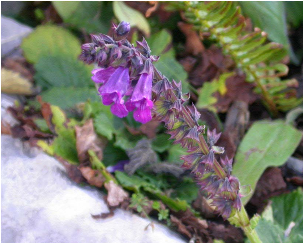
Fotografía 6. Inflorescencia de Horminum pyrenaicum formada por 10-13 verticilastos con (1)2-6 flores cada uno.