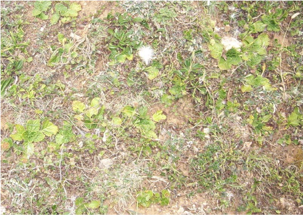
Fotografía 5. Hojas basales de varios ejemplares de Horminum pyrenaicum : dispuestas en roseta pegada al suelo, crenadas, subcoriáceas y de nervadura reticulada.