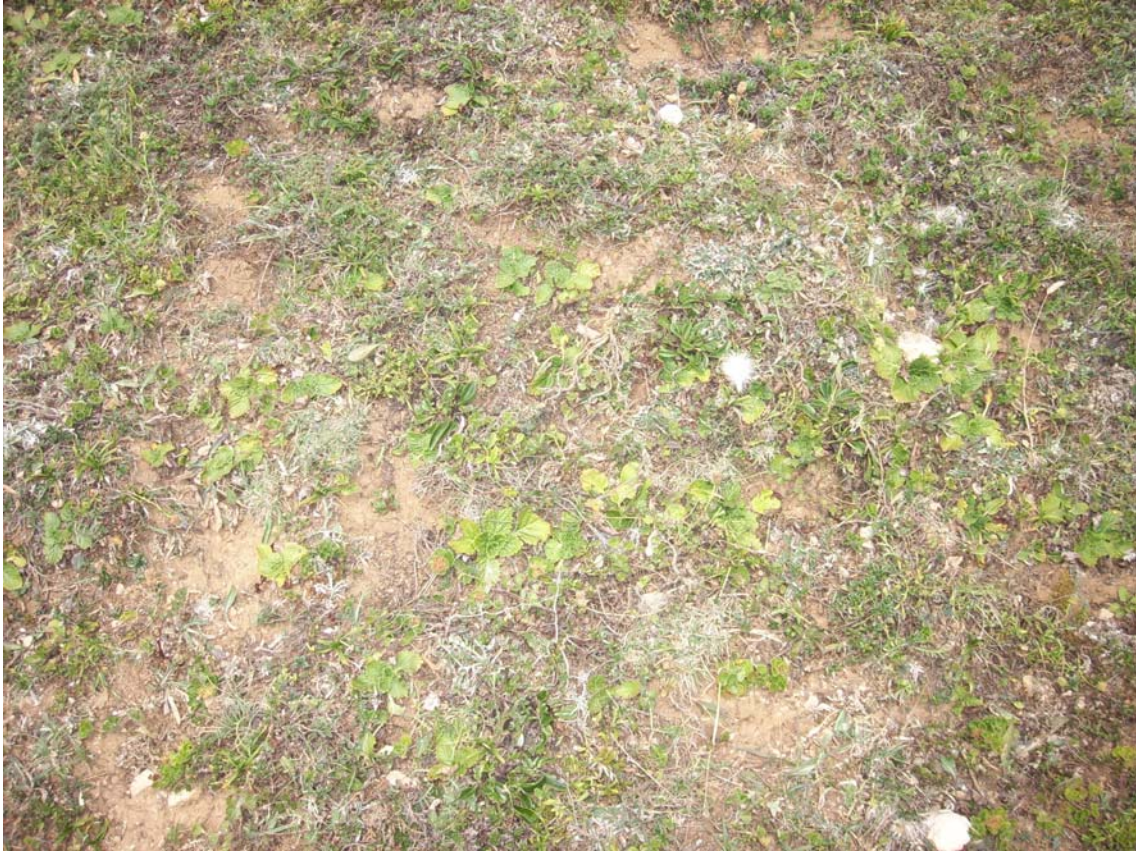
Fotografía 3. Horminum pyrenaicum en su hábitat óptimo (52.b.08.101).