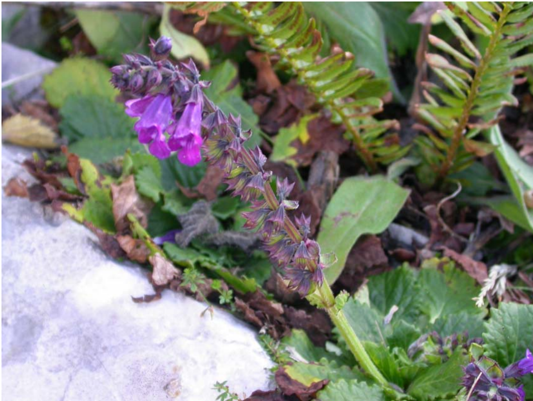
Fotografía 4. Ejemplar de Horminum pyrenaicum .