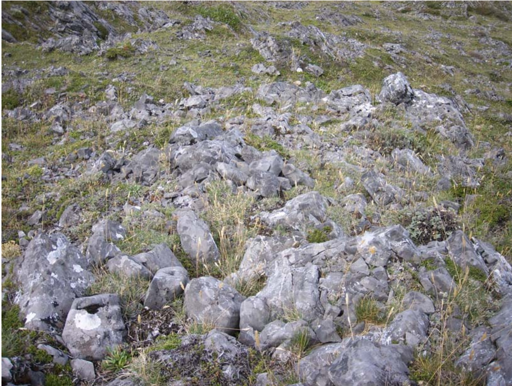
Fotografía 1. Hábitat óptimo de Horminum pyrenaicum en el Valle de Wamba (León): pastos vivaces crioturbadados, basófilos, orocantábricos, del Festucion burnatii (52.b.08.101).