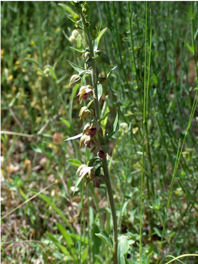
Fotografía 6. Detalles de la inflorescencia