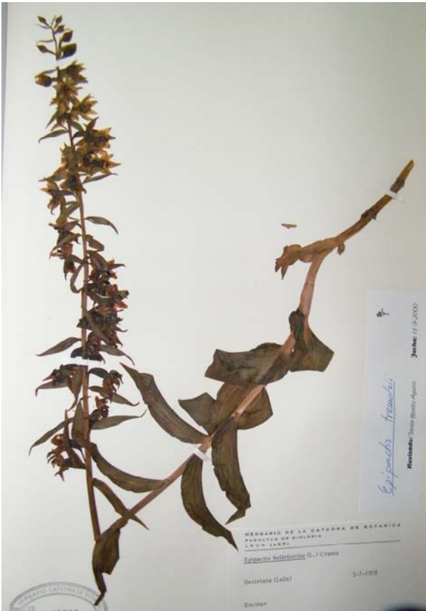
Fotografía 4. Plano general de la planta. Material de herbario (LEB 7722).