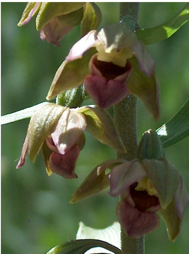
Fotografía 8. Detalles de las flores