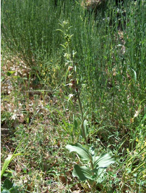
Fotografía 3. Plano general de la planta.