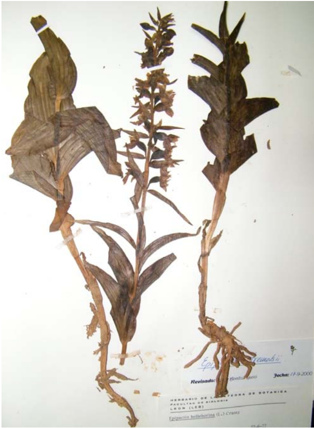
Fotografía 5. Detalles de la parte inferior y superior de la planta. Material de herbario (LEB 7723).