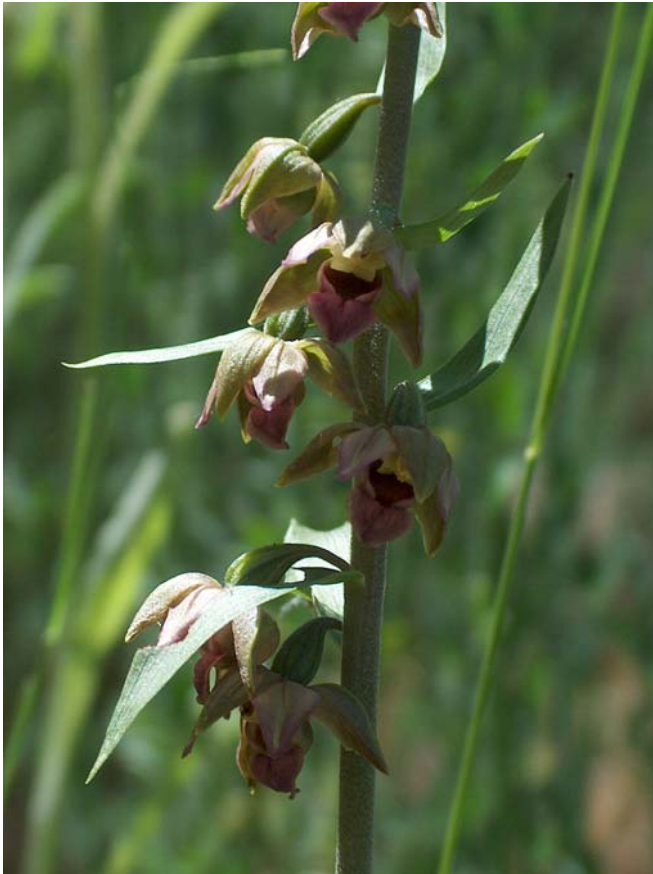
Fotografía 7. Detalles de la parte inferior de la inflorescencia