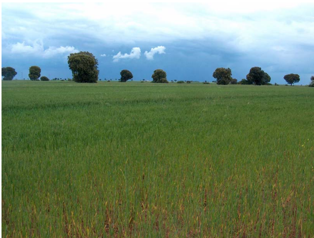
Fotografía 9. Eliminación de hábitats potenciales para especie (en este caso encinares), para cultivos cerealistas.