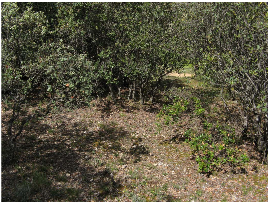
Fotografía 1. Uno de los hábitats óptimos de Epipactis tremolsii : claros de encinares basófilos, en este caso del Asparago acutifolii-Quercetum rotundifoliae