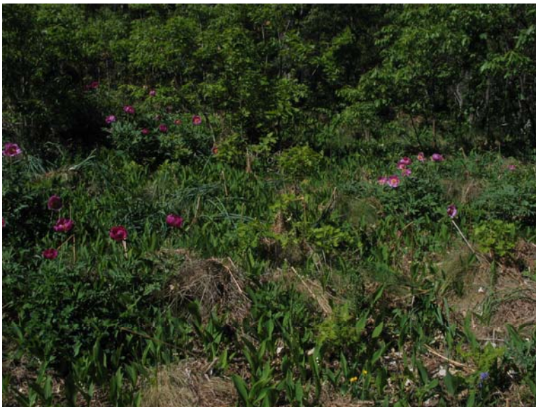
Figura 2. Población de Convallaria majalis en contacto con cerrillar de Festuca elegans subsp. merinoi en un claro de bosque mixto de Pinus sylvestris y Quercus pyrenaica