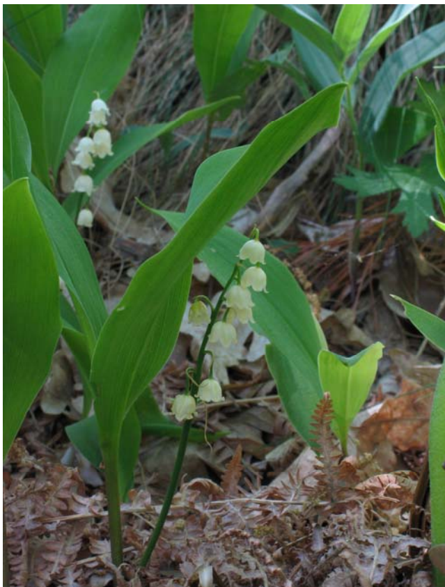
Figura 5. Plano lateral de Convallaria majalis donde se aprecian las hojas en número de 2 y los racimos unilaterales con las flores acampanadas y péndulas.