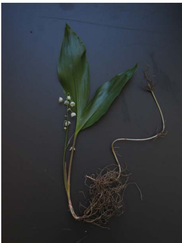
Figura 3. Vista de un ejemplar de Convallaria majalis con los rizomas subterráneos.