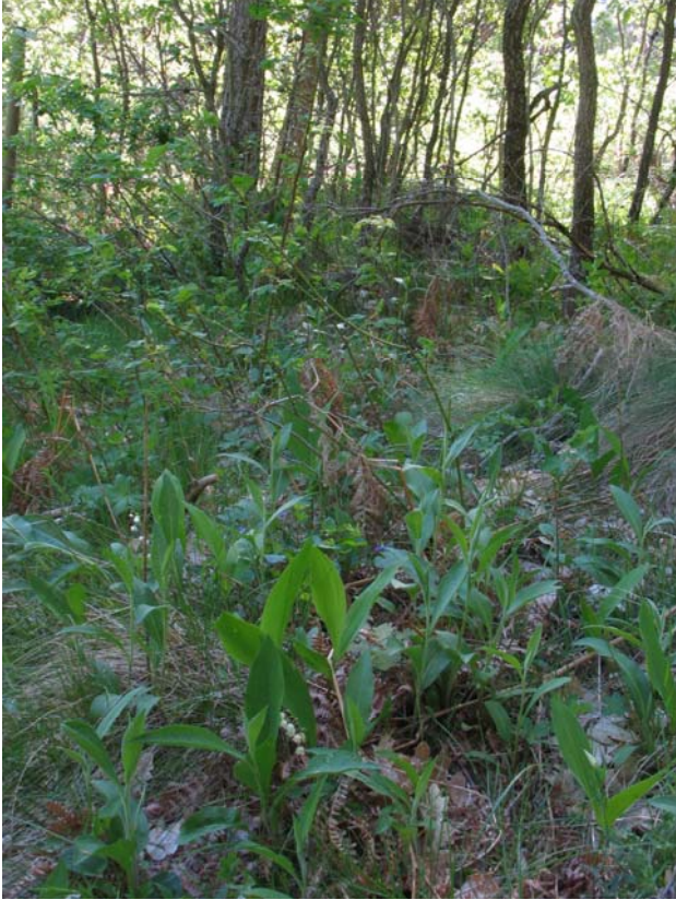
Figura 1. Población de Convallaria majalis bajo el dosel arbóreo de un robleal de Quercus pyrenaica (76.b.07.006).