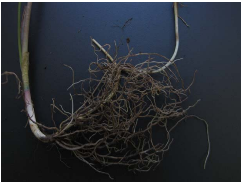
Figura 6. Detalle del rizoma subterráneo.