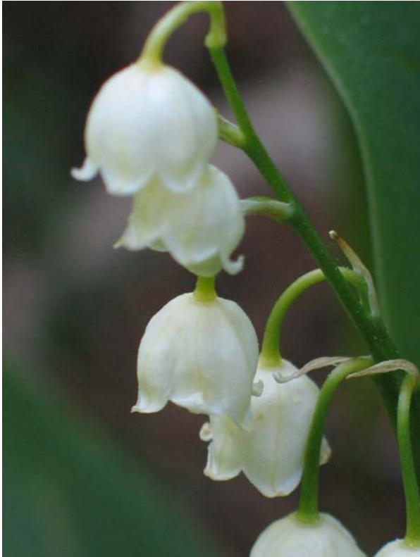
Figura 7. Detalle de los racimos unilaterales.