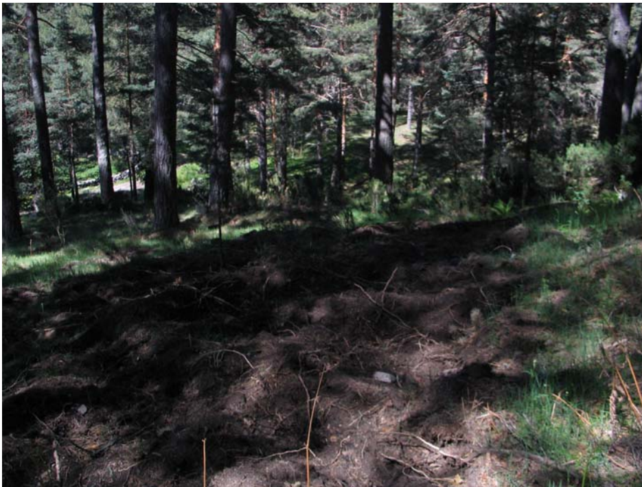
Figura 8. Limpieza de sotobosque con remoción del terreno adyacentes a las poblaciones de Convallaria majalis en Navarredonda de Gredos con los consiguientes perjuicios derivados del posible destroz de rizomas subterráneos.