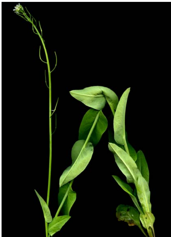
Fotografía 2. Aspecto general de la planta (MALLOL ET BARNOLA, 2010)