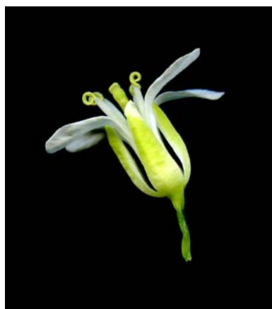
Fotografía 7. Detalle de la flor. (MALLOL ET BARNOLA, 2010)