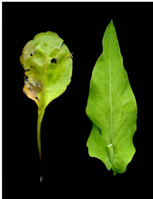
Fotografía 4. Detalle de las hojas. (MALLOL ET BARNOLA, 2010)