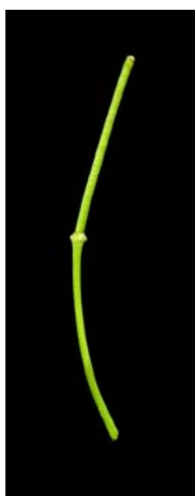
Fotografía 5. Detalle del fruto. (MALLOL ET BARNOLA, 2010)