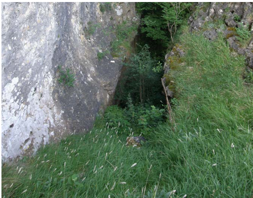
Fotografía 1. Hábitat óptimo de la especie. Herbazales escionitrófilos vivaces del Galio-Alliarion petiolatae (40.a.02.101)