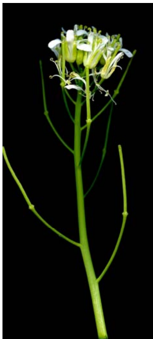
Fotografía 3. Detalle de la inflorescencia. (MALLOL ET BARNOLA, 2010)