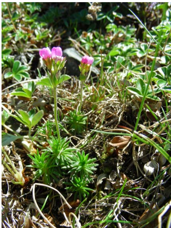
Fotografía 4. Grupo de dos rosetas en flor.