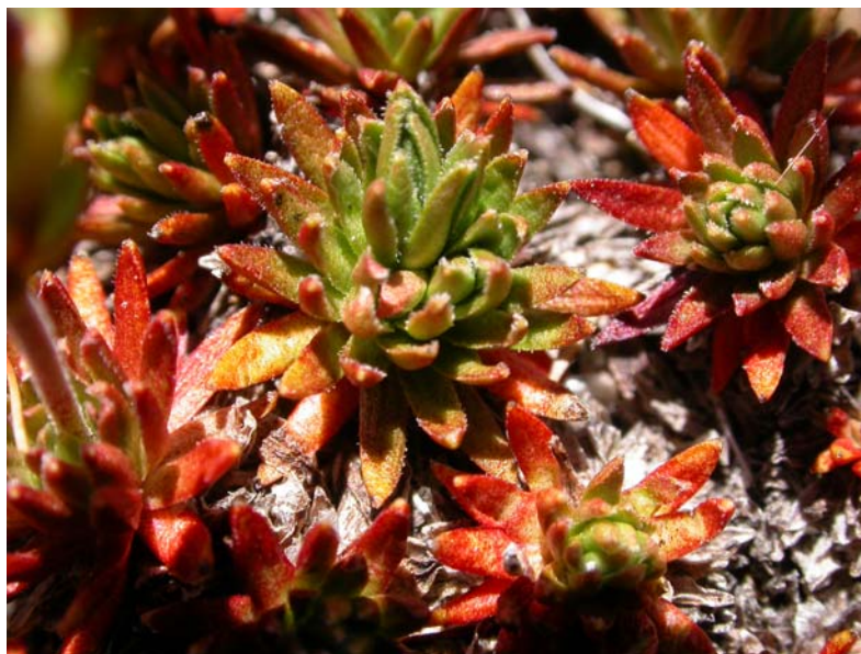
Fotografía 8. Detalle de las hojas: con pelos ganchudos y sin ápice ganchudo.