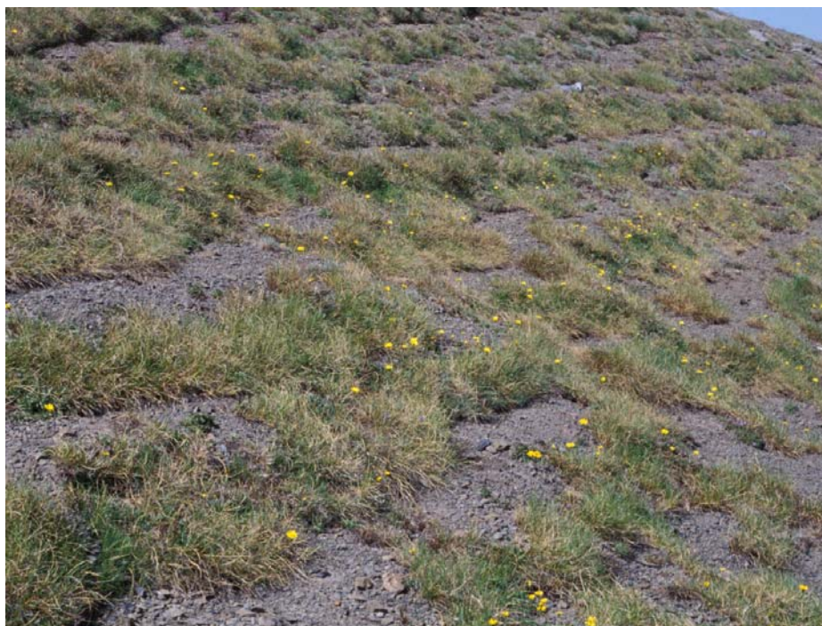
Fotografía 1. Hábitat óptimo de Androsace cantabrica : pastos vivaces de alta montaña, psicroxerófilos, silicícolas, oro-criorotemplados, del Teesdaliopsio-Luzulion caespitosae (49.a.03.101). Es un pastizal del Teesdaliopsio confertae-Festucetum eskiae