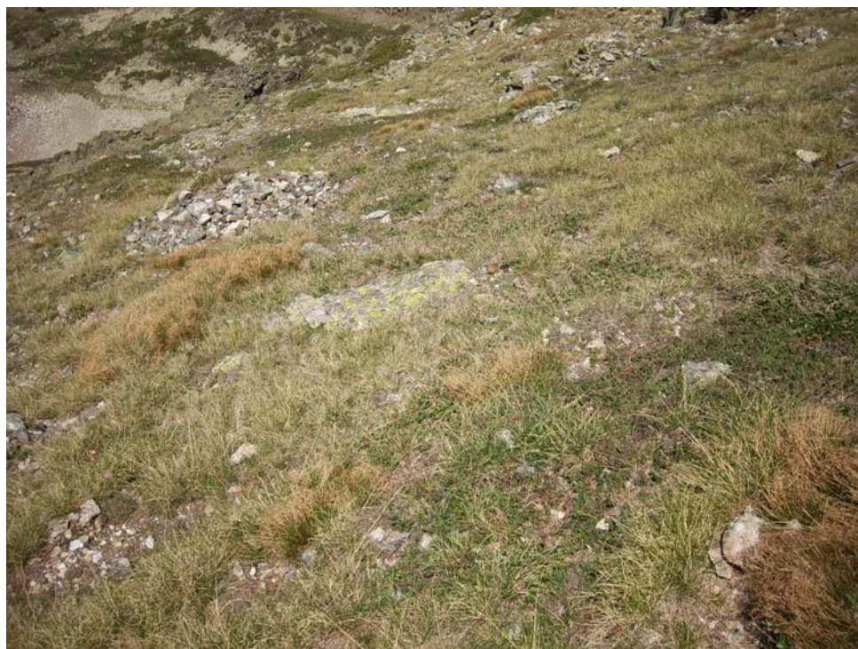
Fotografía 2. Otro hábitat de Androsace cantabrica . En este caso se trata de un pastizal del Junco trifidi-Oreochloetum blankae , propio del piso criorotemplado (49.a.03.101).