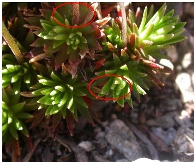
Fotografía 9. Detalle de los escapos (muy pilosos) y de las hojas (con pelos ganchudos).