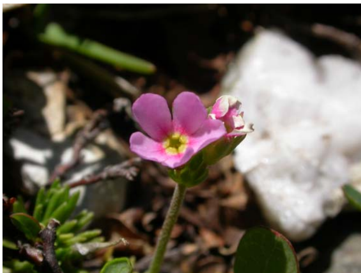
Fotografía 6. Detalle de la flor de Androsace cantabrica . Lóbulos de la corola de coloración rosa intenso.