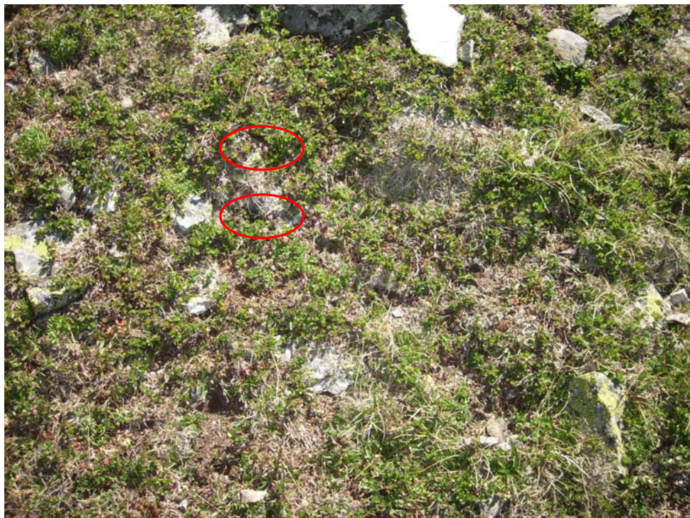
Fotografía 3. Detalle de Androsace cantabrica en la comunidad de enebral rastrero con Vaccinium uliginosum .