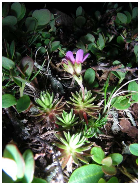
Fotografía 5. Otro ejemplar en flor.